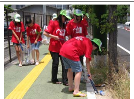
8月5日学習会の後の準備の様子。マイはしの袋の仕上げをしているところです。