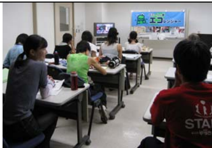
7月29日事前学習会の後、事前PRを兼ねたゴミ拾いをしました。終了後にみんなで。

2007年度は、2月28日をスタートに隔週で合計12回のミーティングを持った。ボランティア参加者の事前学習会を7月29日(日)、8月5日(日)に開催。学習会の後、1回目の7月29日には事前PRとして三原駅前のゴミ拾いを実施、2回目の8月5日は販売用「マイはし」のセットなどの準備をした。