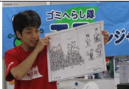
8月5日の事前学習会の様子。