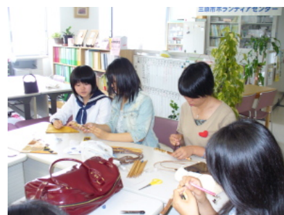
8月5日学習会の後の準備の様子。マイはしの袋の仕上げをしているところです。