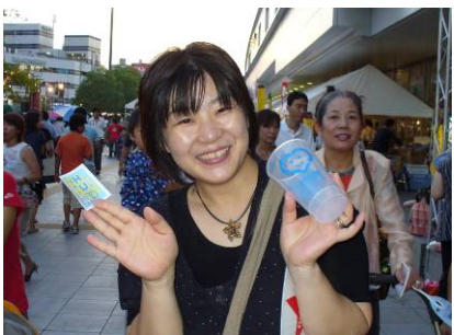
エコレンジャーとのじゃんけんに勝って、 エコマネーGET〜♪