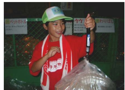
重さを吊りばかりで量っているところ。