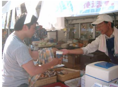
リユースカップで生ビール♪ 屋台村の皆さまにもご協力いただきました。