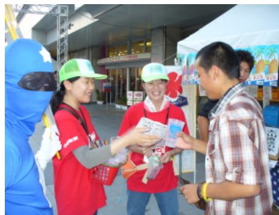
商談成立！ リユースカップを借りてくれました。