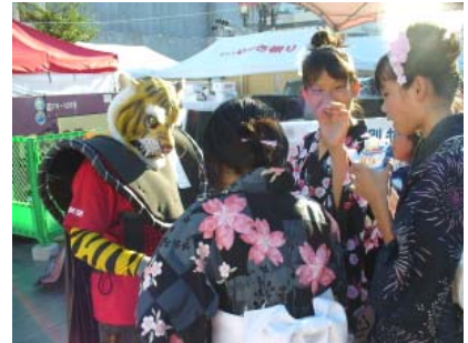
子どもにも女の子にも人気でした！ ゴミ魔王&エコレンジャー。