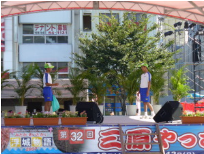
昨年は音声のみだった導入部に、ボランティア参加の中学生が挑戦！