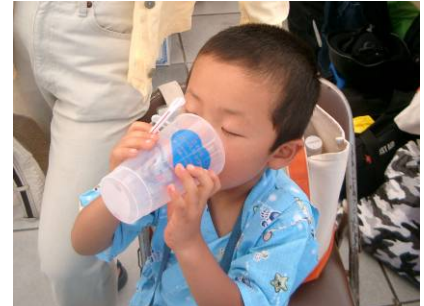
リユースカップでかき氷を食べたよ。おいしく って最後まで全部飲んじゃった(*^^*)