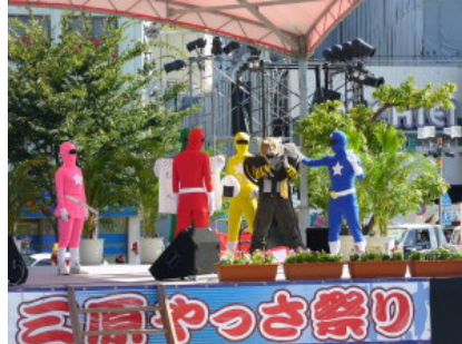
心を入れ替えたゴミ魔王が、ゴミを分別して捨てるシーン。