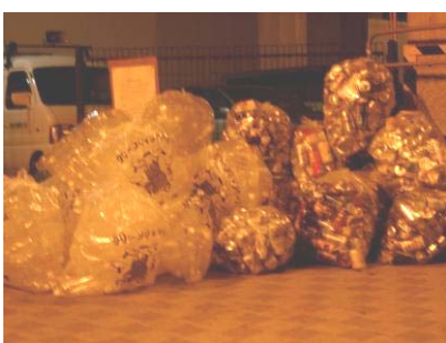
10日(金)のペット・アルミ・スチールの総量。3日間毎日23:00にチューリップ作業所より取りに来ていただいた。