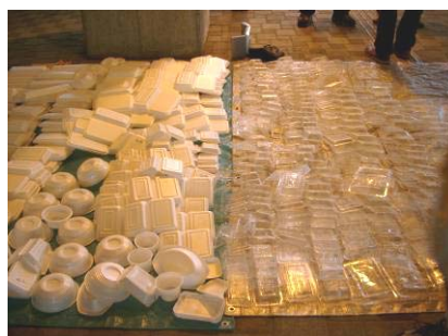
容器包装プラスチックを洗って乾かしているところ。洗えず「燃やすゴミ」としたのも若干ある。