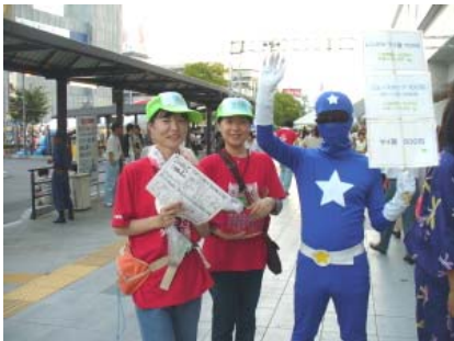
リユースカップの宣伝に歩く エコレンジャー