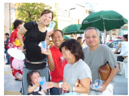
ファミリーでリユースカップ！ 4人分のご利用です。