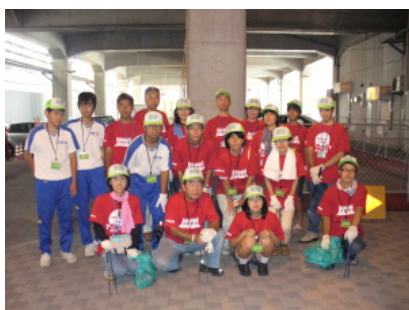
7月29日事前学習会の後、事前PRを兼ねたゴミ拾いをしました。終了後にみんなで。

2007年度は、2月28日をスタートに隔週で合計12回のミーティングを持った。ボランティア参加者の事前学習会を7月29日(日)、8月5日(日)に開催。学習会の後、1回目の7月29日には事前PRとして三原駅前のゴミ拾いを実施、2回目の8月5日は販売用「マイはし」のセットなどの準備をした。