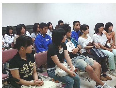
8月5日の事前学習会の様子。