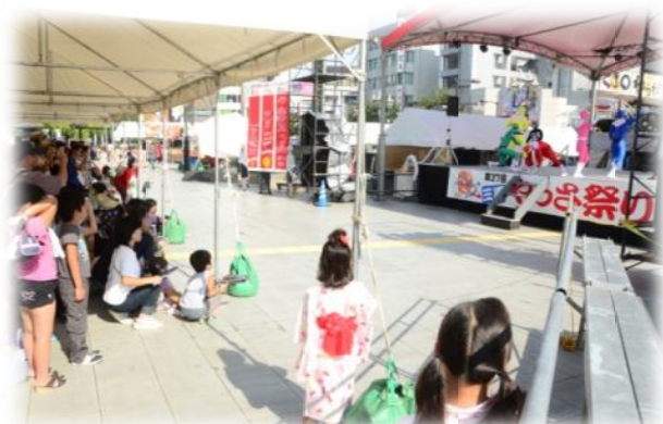
エコレンジャーショーを見る人たち。毎年人気です☆