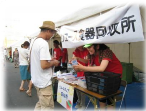
回収所でリユースカップの回収を行う三原高校の生徒さん