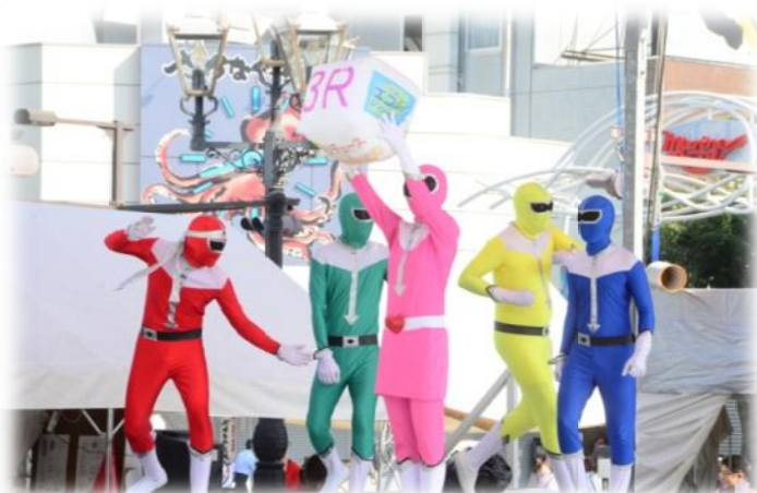
ステージで、3R（リデュース・リユース・リサイクル）の大切さを呼び掛けるエコレンジャー