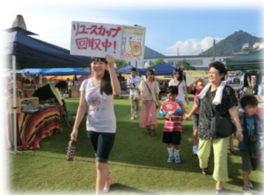
リユースカップの回収を呼び掛けるイオンチアーズクラブ

やっさ祭り開催3日間でのマイ箸販売は売上げがなく残念であった。祭り以外での販売が5セット。